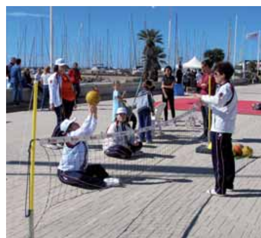
Foto di gruppo e momenti della manifestazione sul piazzale del Porto di Roma.