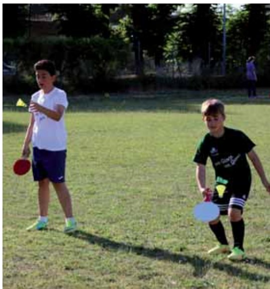
I giovani partecipanti impegnati in una lezione didattica.