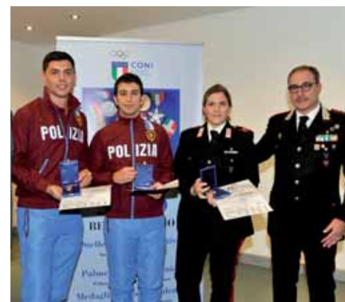
Foto di gruppo per alcune discipline: atletica leggera, sport rotellistici, tiro a volo, nuoto, taekwondo, aeroclub, ginnastica, tiro dinamico sportivo e scherma.