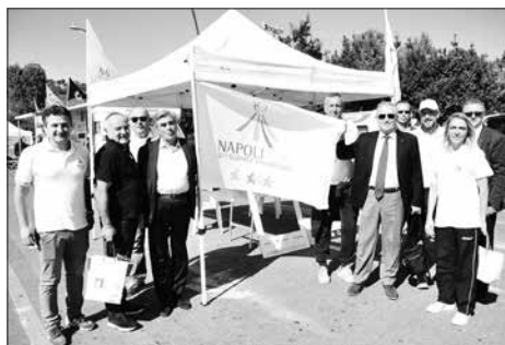
Un momento della settimana europea dello sport sul lungomare di Napoli