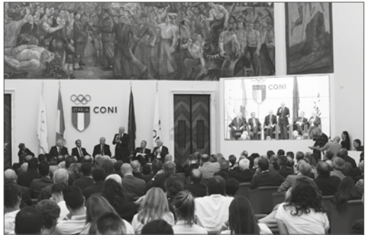
Un momento della presentazione delle Universiadi nel Salone d'onore del C.O.N.I.

L'Universiade 2019 sarà inoltre un'irripetibile occasione di sviluppo economico e di promozione dell'immagine turistica della regione, l'evento con cui poter rappresentare al mondo Napoli e la Campania come il più grande distretto turistico esistente.