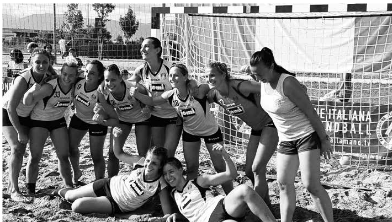
Pdo Salerno Campione d'Italia Beach Handball