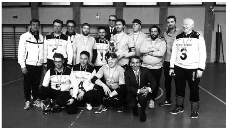
Colosimo Campione d'Italia Goalball