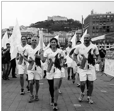
L'arrivo della fiaccola delle Universiadi a Napoli