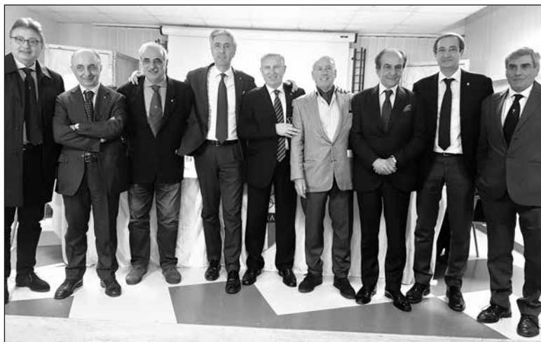
La Giunta Regionale del C.O.N.I. Campania

Il Consiglio Nazionale del CONI, con delibera del 18 luglio 2017 ha approvato le nuove norme che regolano il funzionamento del registro delle società e delle associazioni sportive dilettantistiche. A partire dal 1° Gennaio 2018, con la messa in esercizio del nuovo applicativo, tutte le utenze attualmente attive non saranno più valide e, pertanto, il legale rappresentante di ogni singola associazione/società sportiva, dovrà provvedere ad accreditarsi alla nuova piattaforma https://rssd.coni.it/ .