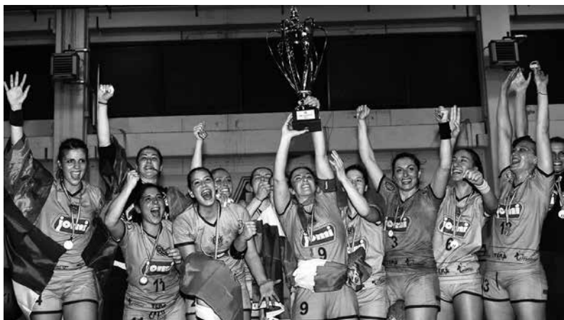
Pdo Salerno Campione d'Italia Pallamano